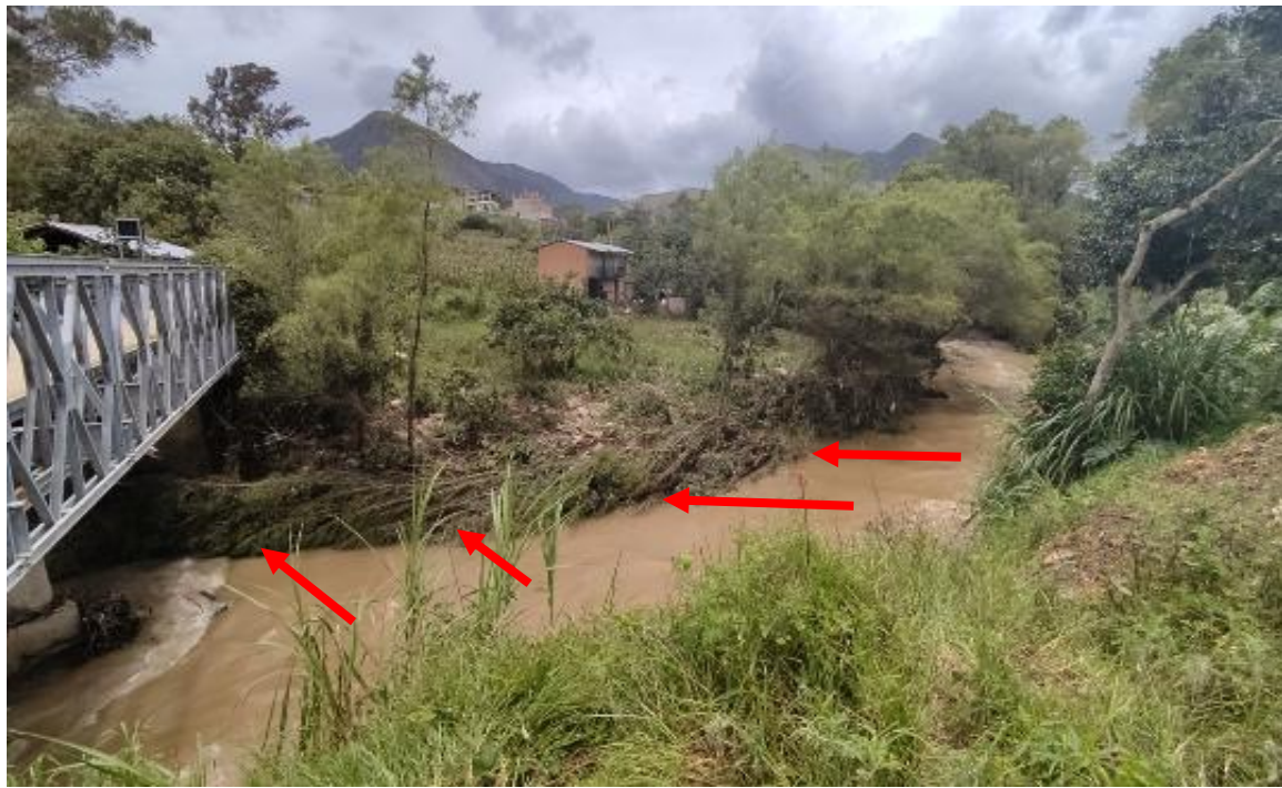
FOTOGRAFIA N°01: TRAMO CRÍTICO EN EL RÍO CONCHÁN (RIO TACABAMBA).