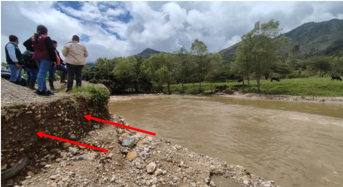
FOTOGRAFIA N°02: SOCAVACIÓN EN Y ACUMULACION DE MATERIAL EN EL RÍO CONCHÁN (RIO TACABAMBA), EN LA TEMPORADA DE MAXIMAS AVENIDAS..